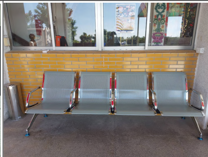
納骨堂購置四人排椅