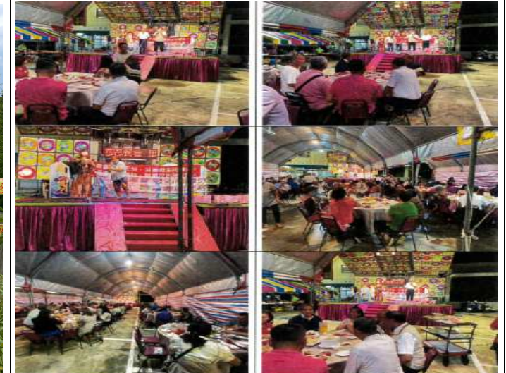
深坑里防災防疫宣導及里民文康活動