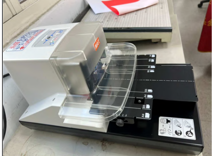
購置美克司 EH-110F 釘書機一台