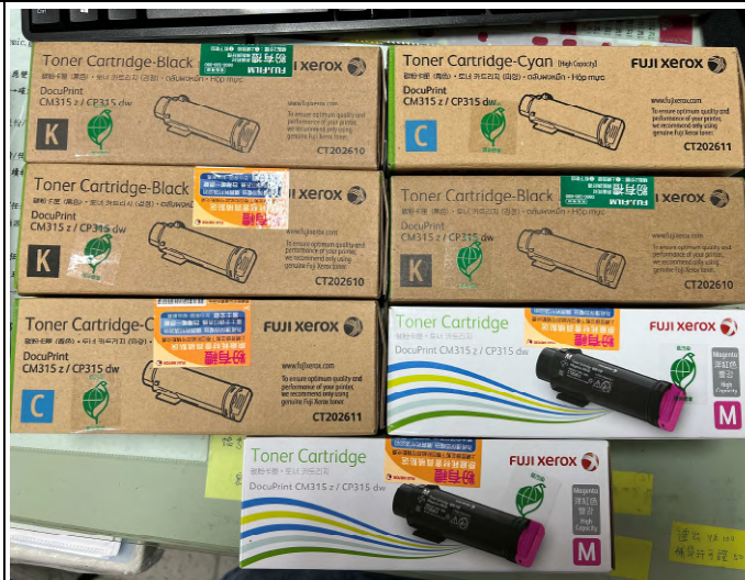
購置 CM315 黑、藍、紅色碳粉匣