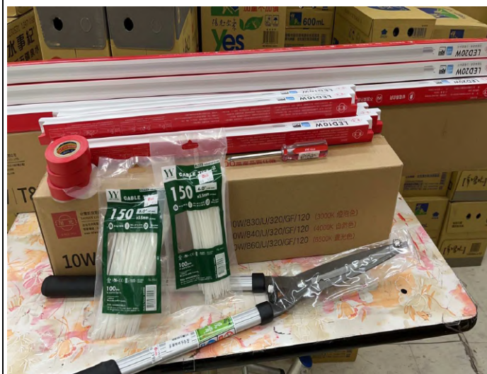
購置 LED 燈管、膠帶等五金用品