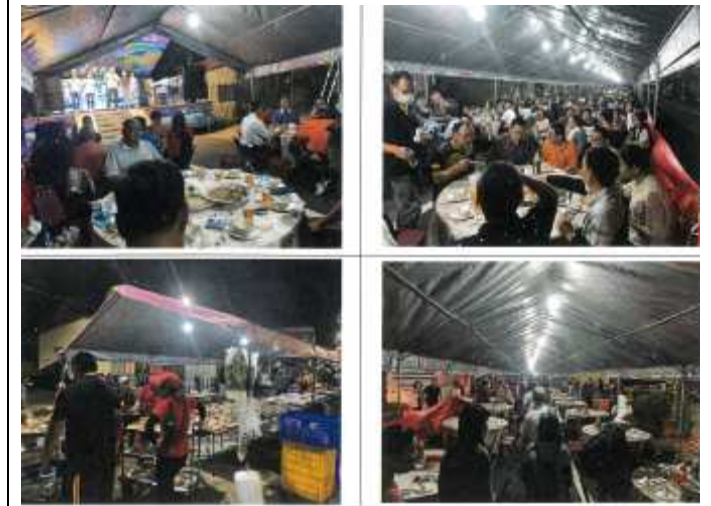
山西里里民聯誼活動