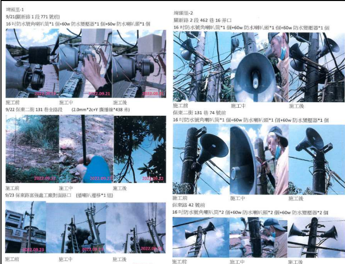
埤頭里辦公處廣播系統喇叭、線路維護