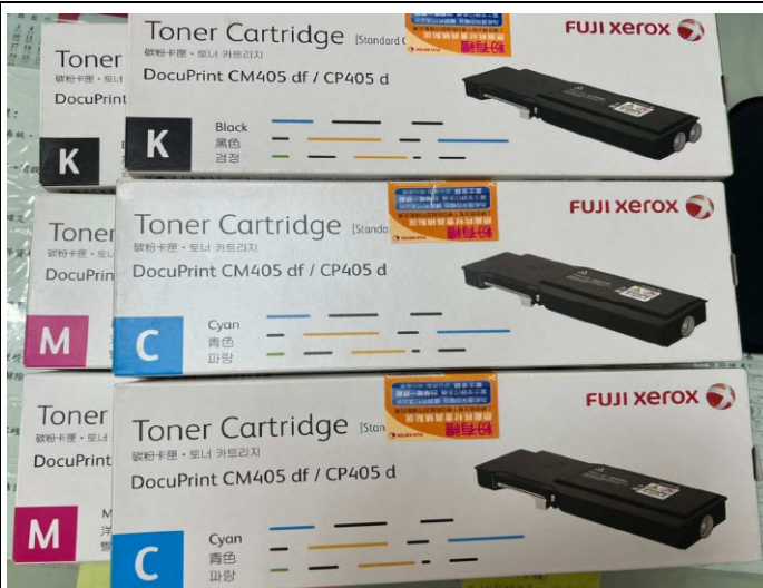
購置 CP405d 碳粉匣