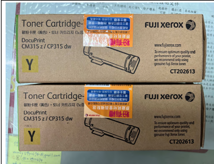
購置 CM315 黃色碳粉匣