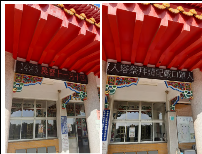
納骨堂購置單面全彩色字幕機