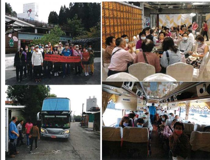
龜洞里里民基層建設觀摩活動