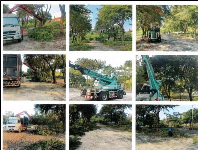
納骨堂下方停車場印度紫檀及金露花修剪