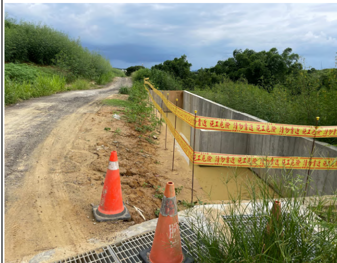
第一公墓第四期綠美化滯洪池警示用品