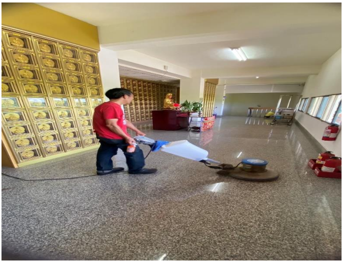
納骨堂塔內1-3樓地板打蠟