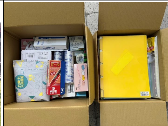
購買九乘九文具用品