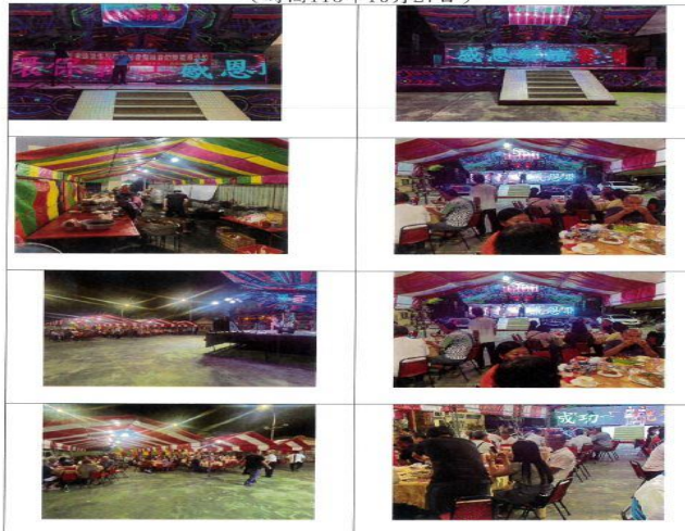
埤頭里辦理航噪改善宣導活動

113 年度埤頭里噪音改善宣導活動-里民聯誼餐會成果照片 (時間 113 年 10 月 27 日)