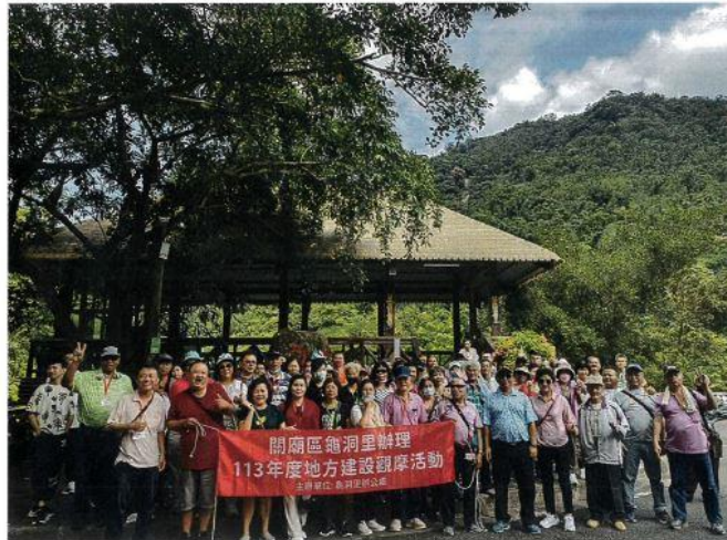
龜洞里里民地方建設觀摩活動