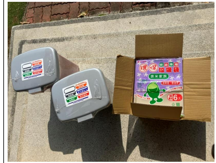
購買納骨堂清潔用品(垃圾桶、袋)