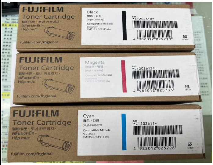
購買CM315黑、紅、藍三色碳粉匣