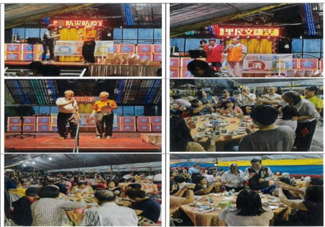
深坑里辦理防災防疫宣導及里民文康活動