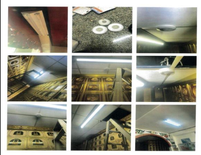
納骨堂塔內電燈維修