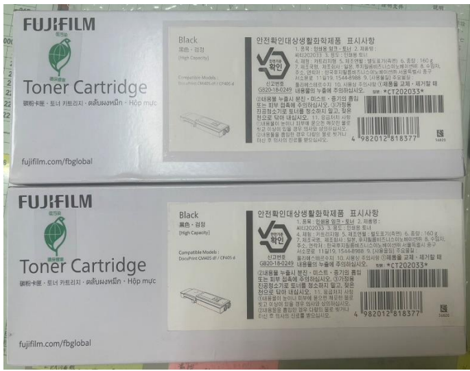
購買富士405d黑色碳粉匣