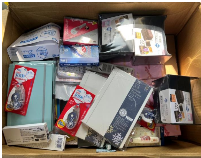
購買九乘九文具用品

113 年度埤頭里噪音改善宣導活動-里民聯誼餐會成果照片 (時間 113 年 10 月 27 日)