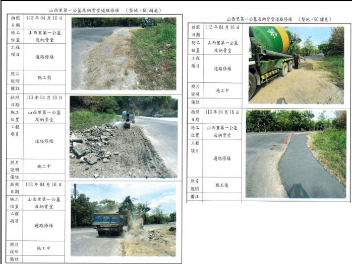
第一公墓及納骨堂道路修繕