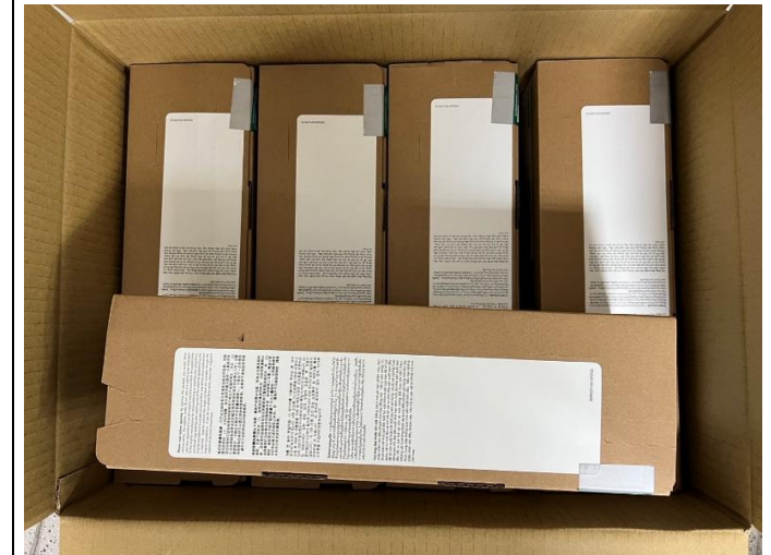
購買富士C2410SD印表機四色碳粉匣